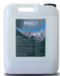
Formati Bottiglia Dosatrice 1 Kg Tanica da 10 Kg